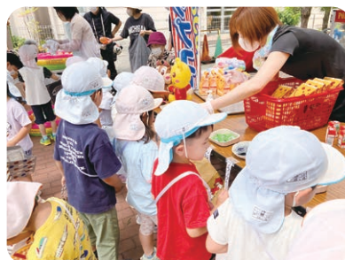
『いろいろなお店がある！迷っちゃうなあ…』