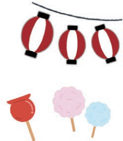
『職員が咲かす笑顔の花、オーレー！』

6月の梅雨入り前のぽっかりと晴れた空に、楽しい音楽と子ども達の笑い声が響きました。