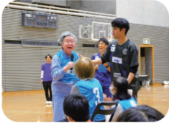
クリアソン新宿との交流イベント

新型コロナウイルス感染症の流行により地域交流が難しい時期が長く続きましたが、現在は新宿区を代表するサッカークラブ「クリアソン新宿」との交流イベント、新宿区主催の「打ち水大作戦」への参加、町会の餅つきイベントへの参加など、さまざまな形で積極的に地域交流を図っています。