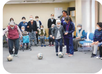
クリアソン新宿との交流イベント

原町高齢者複合施設は新宿区で原町小規模多機能居宅介護センターと原町グループホームの2つの事業を運営しています。