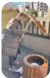
町会の餅つき大会