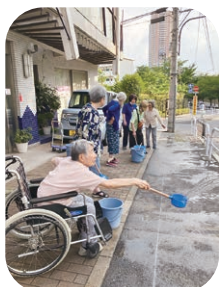
新宿区打ち水大作戦

これからも地域社会とともに福祉のまちづくりに取り組む歩みを進めながら、いわゆる「普段着のご近所付き合い」ができる関係性を大切にしていきたいと思えます。