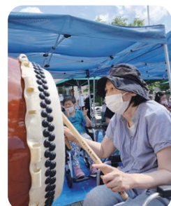
『利用者の方も参加しました！』