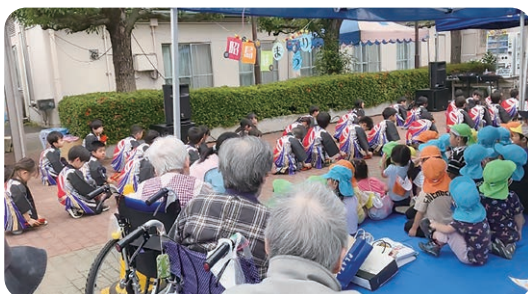
『子ども達も堂々と演目を披露しました』