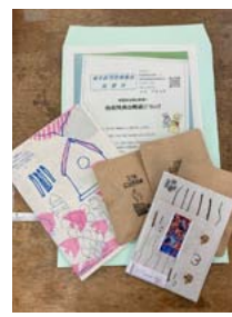
後援会入会特典の一部ご案内