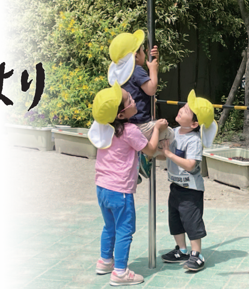
「もうちょっとでのぼれるよ！」同援さくら保育園