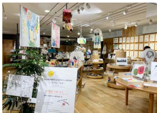
令和5年7月「吉祥寺マルイ無印良品にて」