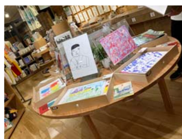
▲「10人の利用者さんの原画」