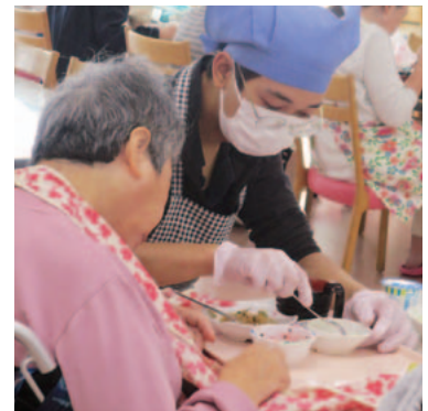
「卒園した方の就職先施設にて」

児童養護施設の卒園生に対しては、現在、自立支援担当の職員が主にそのアフターケアを行っています。必要に応じて、訪問したり、電話等で悩みを聞いたりして自立のサポートをしています。卒園した子どもの中には、すでに対人関係や自身のモチベーションの低下で仕事や学校に行かなくなってしまっているケースもでてきています。積み重なると家賃の滞納や学校の単位がとれず、進学ができなくなってしまうため、丁寧な支援が必要になってきます。しかし実際には、家を退去しなければならなくなり、自己破産を申請せざるを得ない状況になる子どももいます。