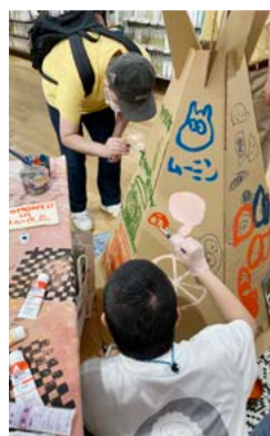
「飛び入り参加で楽しいアート!!」