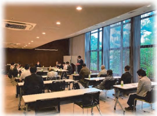
「2023年度 後援会役員会及び総会 より」

後援会でご支援いただいたご寄付などは東京都同胞援護会を通じて、施設整備費や事業助成金の一部として、利用者の皆さまの笑顔のために使わせていただいております。このほかにも法人施設の運営に協力させていただいております。