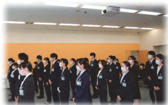
「2023年度 辞令交付式 より」

つきましては、後援会員の皆様には引き続きご加入いただきますと共に、まだ加入されていない皆様におかれましても、後援会の趣旨にご賛同いただき、新たにご加入頂きますようお願い申し上げます。