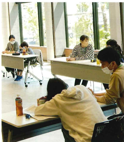
同援こども学習室 ：ラスク

地域への取組みについては、昨年に引き続き、活動そのものが限定的とはなりましたが、感染防止に努めながら、生活困窮家庭の子どもの学習支援や法人独自の低所得者に対する利用料の負担軽減、地域見守り配食などの社会貢献活動をおこなってまいりました。