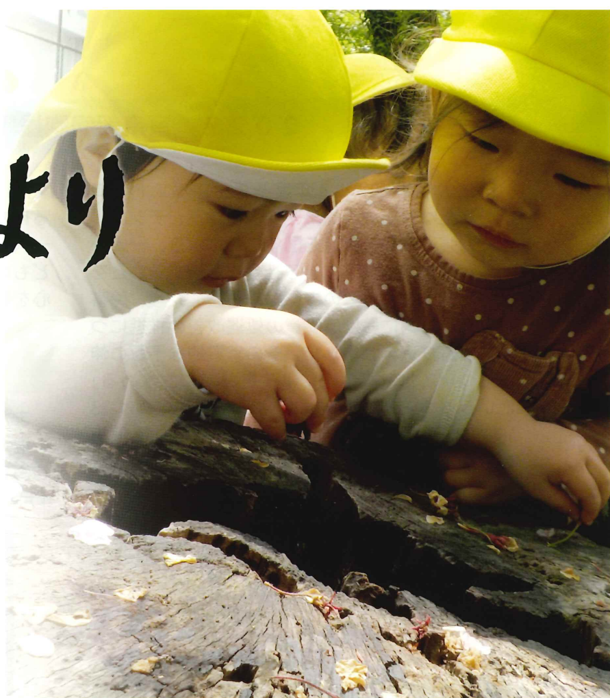
「だんご虫みつけた！」みなと保育園

2022 東京都同胞援護会 事業計画 就任・退任挨拶 施設通信 ～輝ける未来に向けて～ 2021 東京都同胞援護会 事業報告