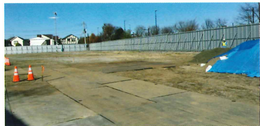
杉並区久我山1丁目：障害者施設計画予定地

また、杉並区久我山1丁目の「都有地活用による地域の福祉インフラ整備事業（障害者施設・知的障害者通所施設・グループホーム）令和7年4月開所予定」の運営事業者に選定されました。