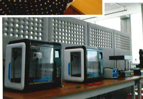
～ 3D プリンター ～