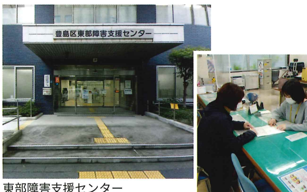
東部障害支援センター

力をいただきながら、新たな子育て拠点としての同援いぐさ保育園の建設に着手し、限られた工期の中で予定通り2022年4月1日に開園いたしました。関係された皆様には心より御礼申し上げます。