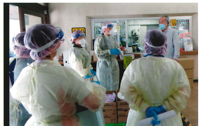
昭島病院感染対策チーム

次に施設運営につきましては、新型コロナウイルス感染症が利用者やその家族及び職員へ感染拡大する中においても、福祉サービスの適切な事業の継続に努めてまいりました。昭島病院と連携し、濃厚接触者に対するPCR検査の実施や入院を必要とする利用者を受入れてまいりました。