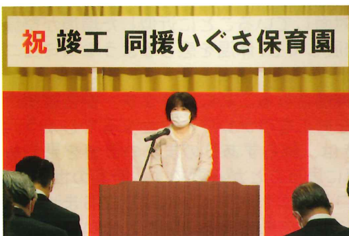
同援いぐさ保育園お披露目会

まず、地域に根差した事業の着実な継続として、杉並区において定員60名の同援いぐさ保育園を開設し、駅前保育という利便性を活かした魅力ある保育サービスを提供してまいります。