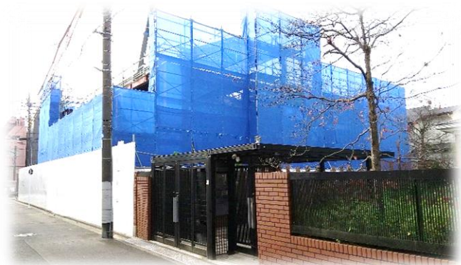
同援いぐさ保育園(2022年4月open)

法人設立75周年を経てもなお、乳児から高齢者まで、多岐にわたる利用者ニーズに応えようと利用者サービスの質の向上、充実のため創意工夫を続ける東京都同胞援護会とともに今後も歩みを続けてまいります。