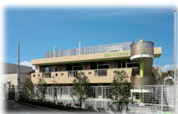
同援いぐさ保育園(2022年4月open)

今春、杉並区内に同援いぐさ保育園が開設されました。温かみのある色合いの園舎が心温かい職員と共に園児やご家族を迎え入れました。瞬く間に季節も移り変わり、少したくましくなった園児たちが、楽しみの沢山詰まった夏の到来を喜んでいる姿も目に浮かびます。園児たちにとって大きなお城となる園舎と共に、ご家族や職員と一緒に園児たち一人ひとりの健やかな成長を見守り続けていきたいと思えます。